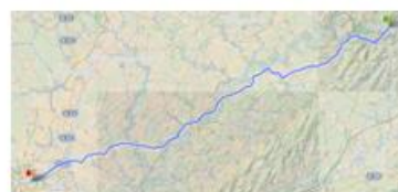
Balade le dimanche