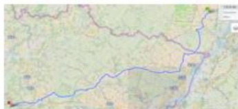
Accueil à Gray

Herxheim → Sarrebourg (131km) → Vesoul (172km) → Saint-Apollinaire (110km)